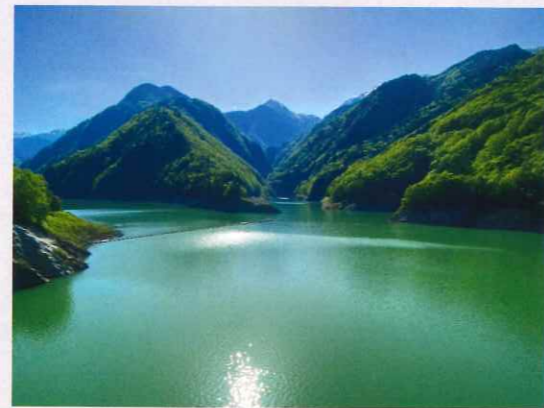
温泉と花崗岩の成分によりエメラルドグリーンに輝く龍神湖

迷路のようなトンネルを進みドアを開けると、先程上から見たあの轟々と吹き出る放流口の直上に出ました。大町ダムには放流する設備が3つあり、今回運良く見られたのはそのうち1つの設備からの放流で、基本小雨が降った際に使用するそうです。その放流量は1秒間に3t。最大で25tの水を放流する事が出来るそうです。あまりの迫力に声を上げましたが、爆音にかき消されてしまいました。日本は梅雨や台風など豪雨が集中する国。高低差が激しく幅が狭い日本の河川は、大雨が降ると一気に流れ洪水をもたらします。一方、日照りが続けば水不足となります。私達の生活を災害から