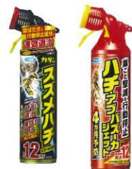
約4ヶ月間の巣作り予防効果