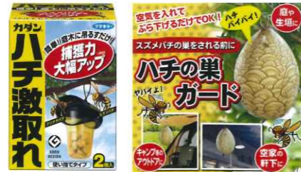
殺虫剤を使わない予防方法

※弊社では取り扱いがございませんのでお手数ですが量販店、ネット通販等でお買い求めください。 ※管理センター窓口にてポイズンリムーバー(蜂刺されの際に使用する吸引器)を販売しております。1個2,000円(税込)