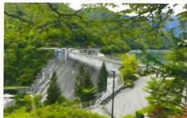
大町ダム 龍神湖 ホームページ